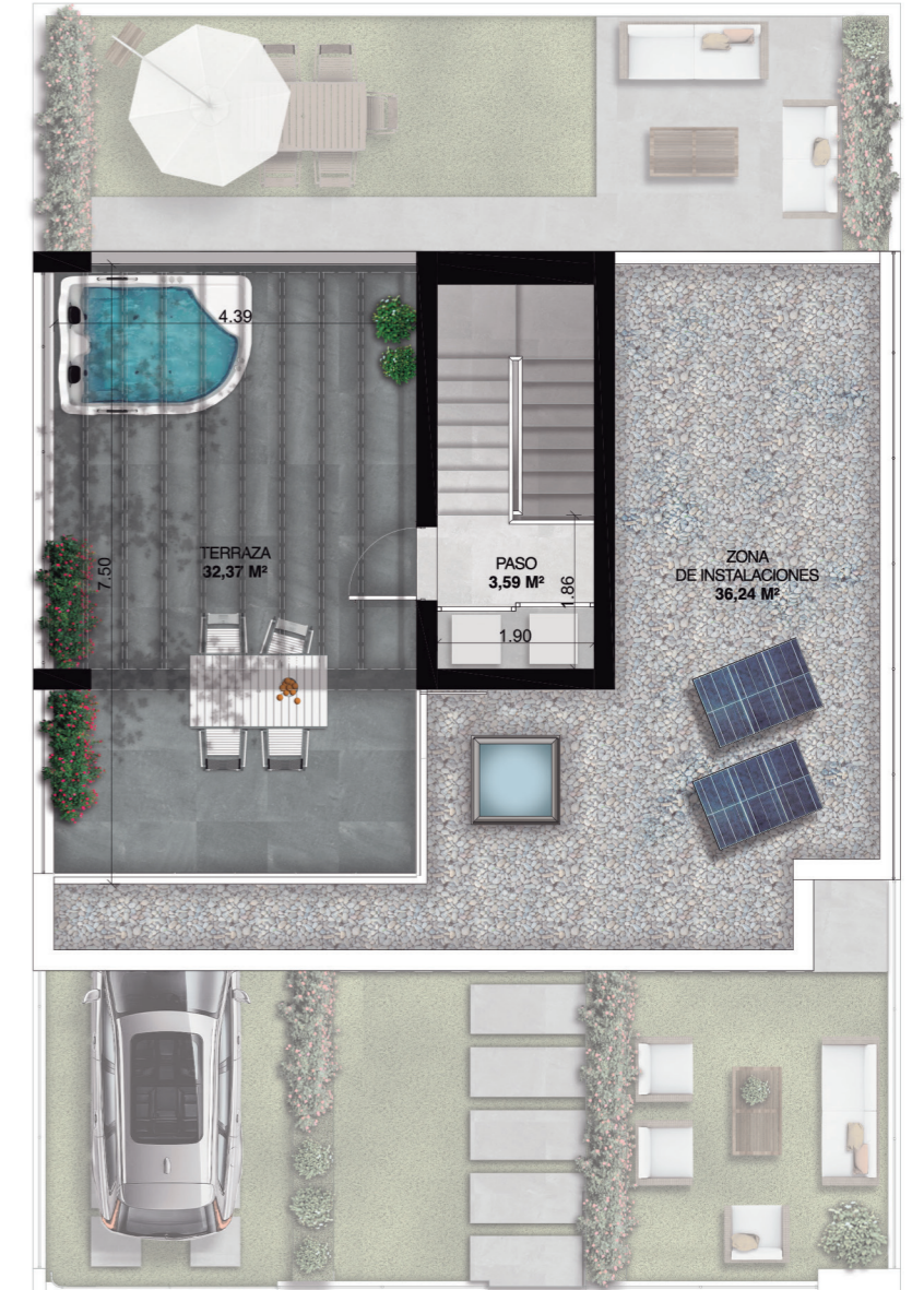
Planta de Cubiertas

Superficie Útil Total (D218/2005): 69,02 m 2 Superficie Construida (D218/2005): 89,13 m 2