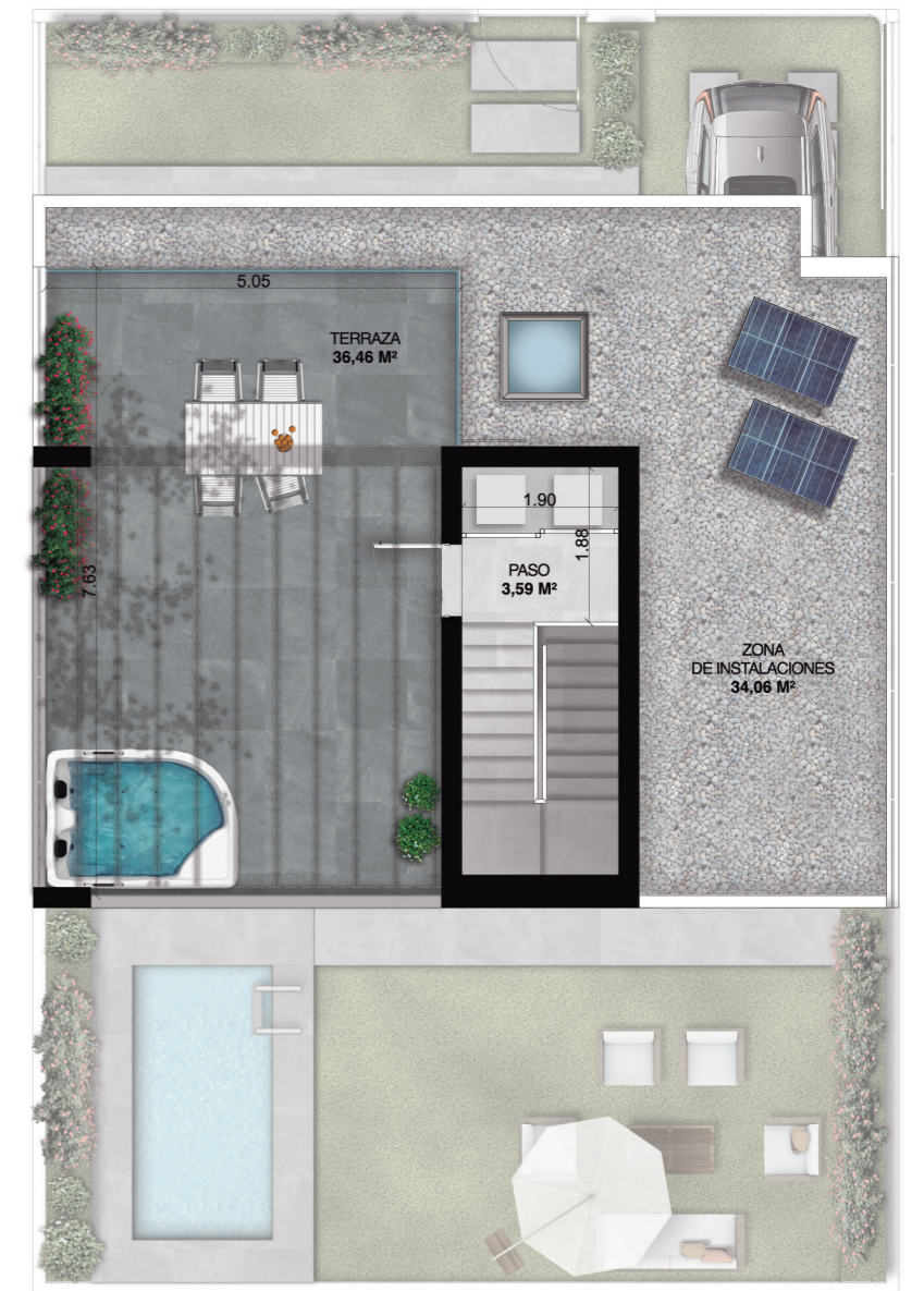
Planta de Cubiertas

Superficie Útil Total (D218/2005): 69,08 m 2 Superficie Construida (D218/2005): 86,71 m 2