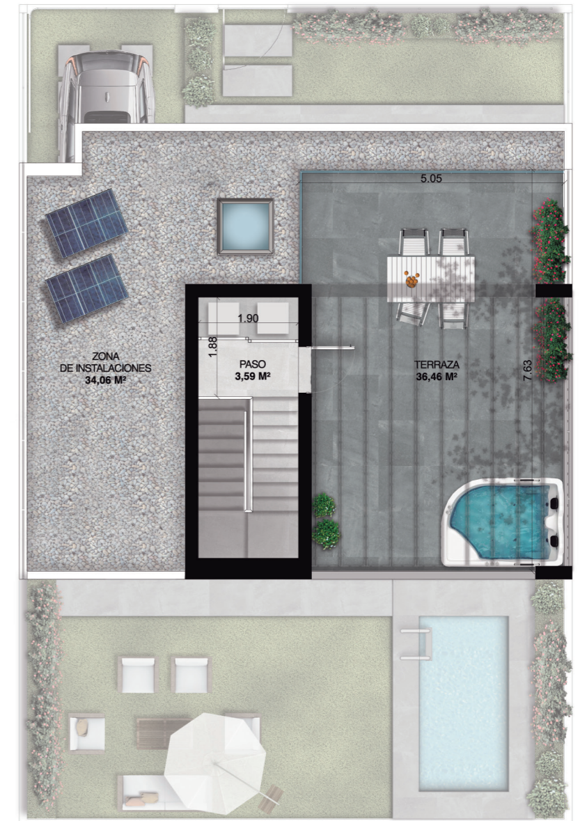
Planta de Cubiertas

Superficie Útil Total (D218/2005): 69,08 m 2 Superficie Construida (D218/2005): 86,71 m 2