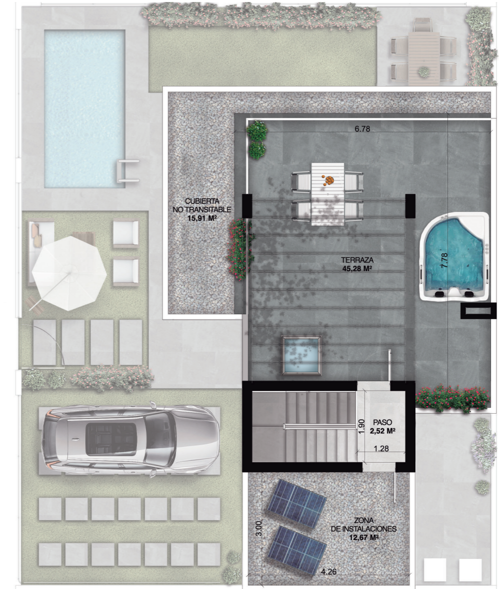
Planta de Cubiertas

Superficie Útil Total (D218/2005): 70,10 m 2 Superficie Construida (D218/2005): 89,73 m 2